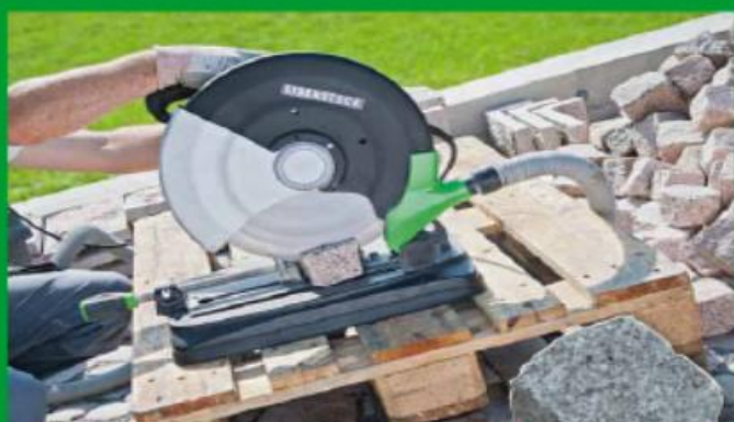
Naturstein, z. B. Granit